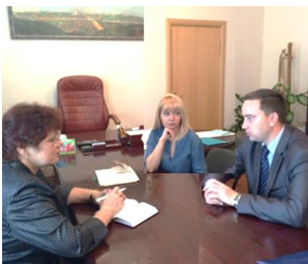
Встреча в СГУ. Смоленск, 22.06.2015