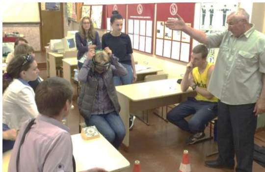
Занятие «Алкоголь и риски вождения» в автошколе г. Катынь Смоленской области 22.06.2015

22 июня открытый урок «Алкоголь и риски вождения» прошел в автошколе техникума отраслевых технологий г. Катынь Смоленской области.