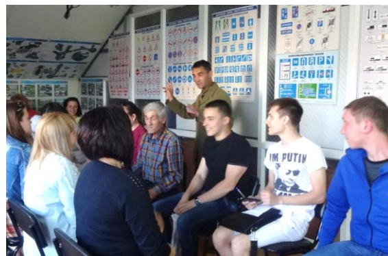
Занятие «Алкоголь и риски вождения» в автошколе «Фортуна Плюс А» г. Стерлитамак, июнь 2015

http://sustainabilityrussia.ru/avtotrezvost/news/